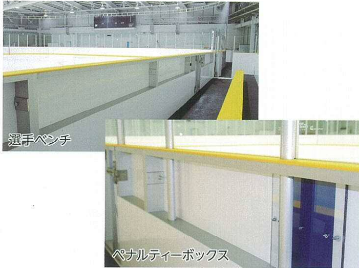
上部を透明なボードと入れ替えることによりアイススレッジ対応となる選手ベンチとペナルティーボックス

新ときわスケートセンターは、多目的トイレ、車椅子用観覧スペースの設置、通路等とリンク面の段差に配慮した、利用者にやさしい施設となっております。