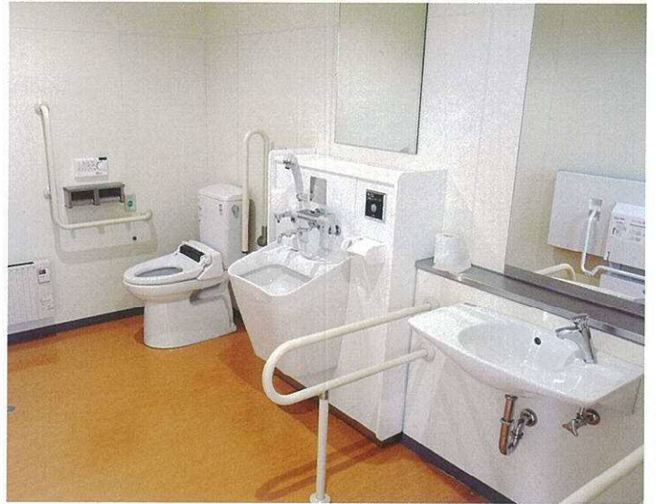
オストメイト、多目的シート、身障者用トイレを設置