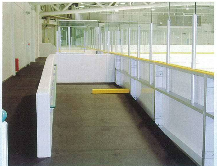
車椅子用観覧スペース